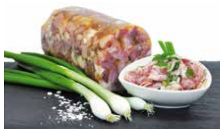
EISBEINBLOCK I Z. B. FÜR „EISBEINSALAT“

hoher schweinefleischanteil. am besten dünn geschnitten und leicht mit vinaigrette mariniert.